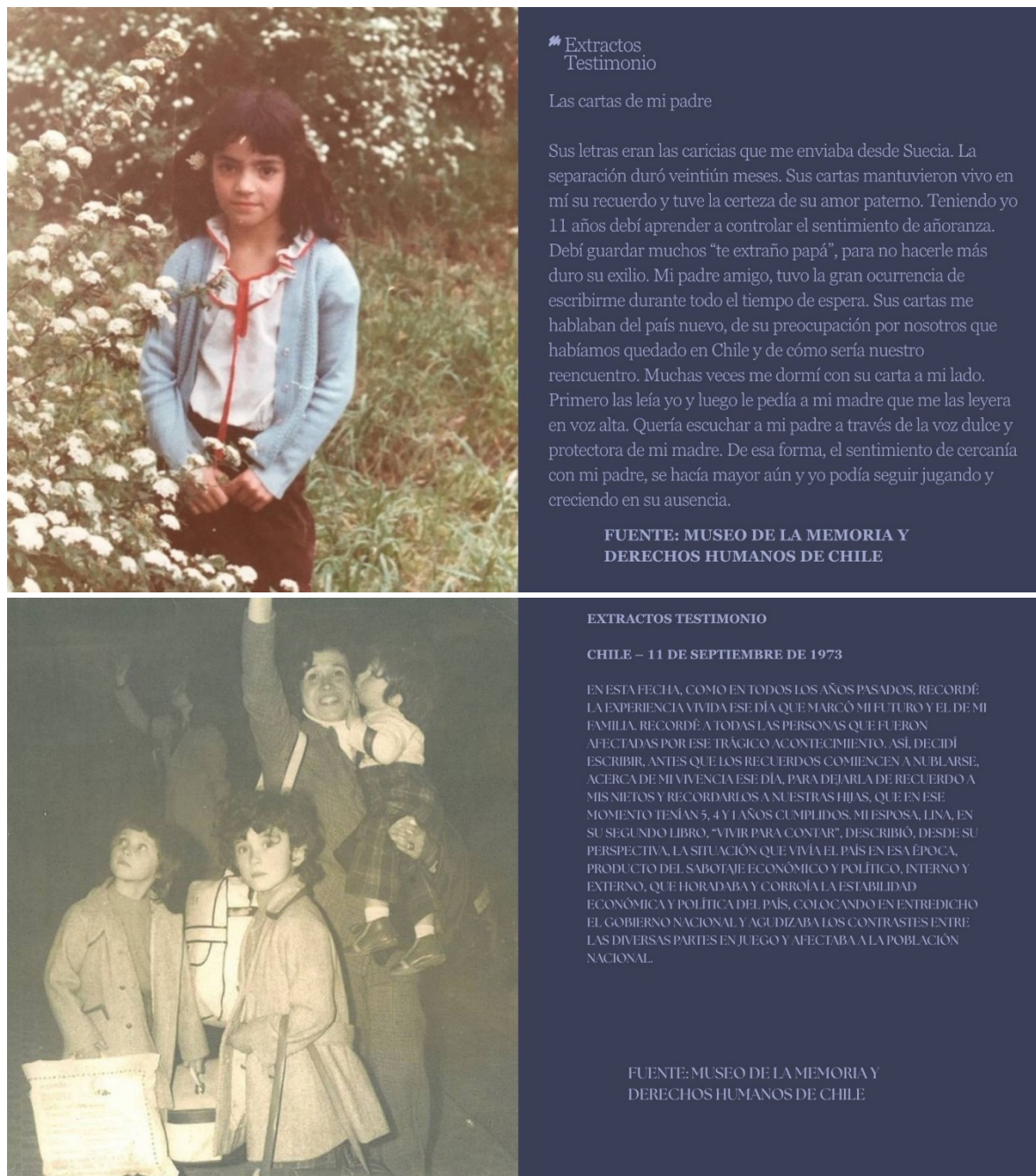
Figura 1. Fragmentos de las narraciones de exilio.